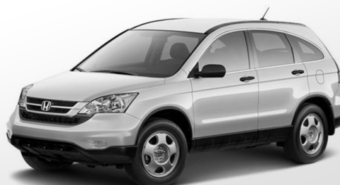
HONDA CR-V III